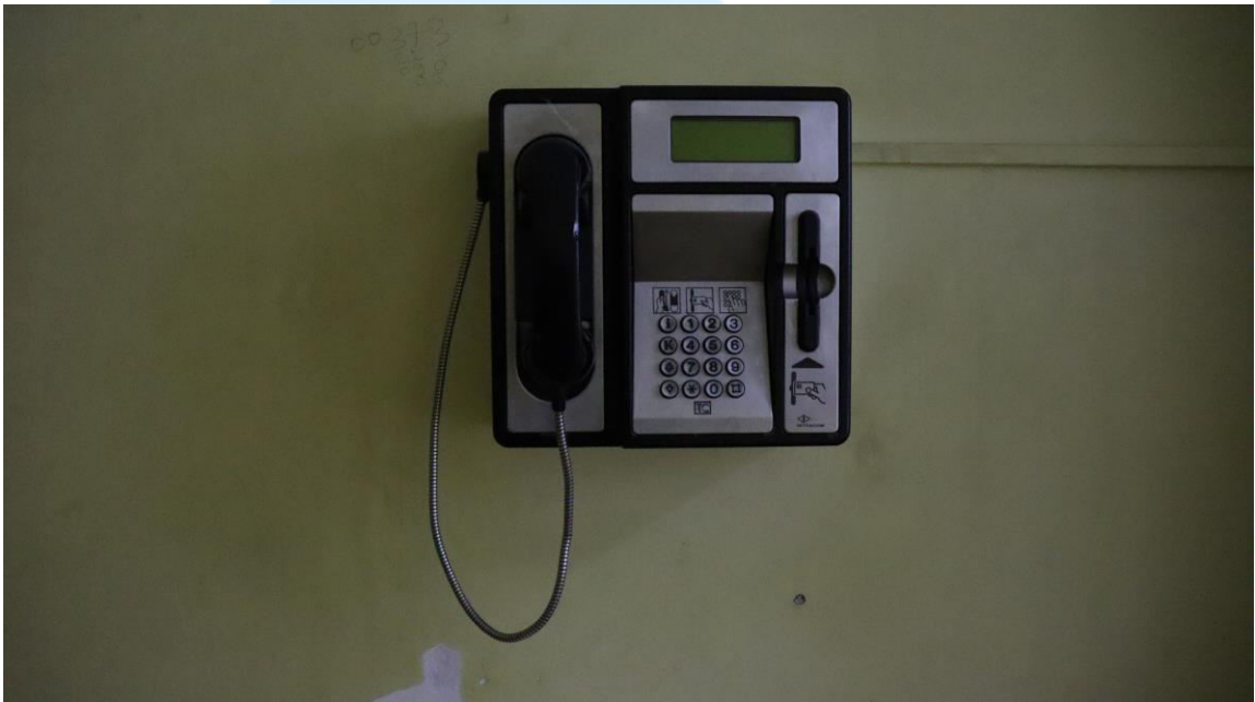
Foto_OAP_telefonul public_nefuncțional_bloc I_CPTS