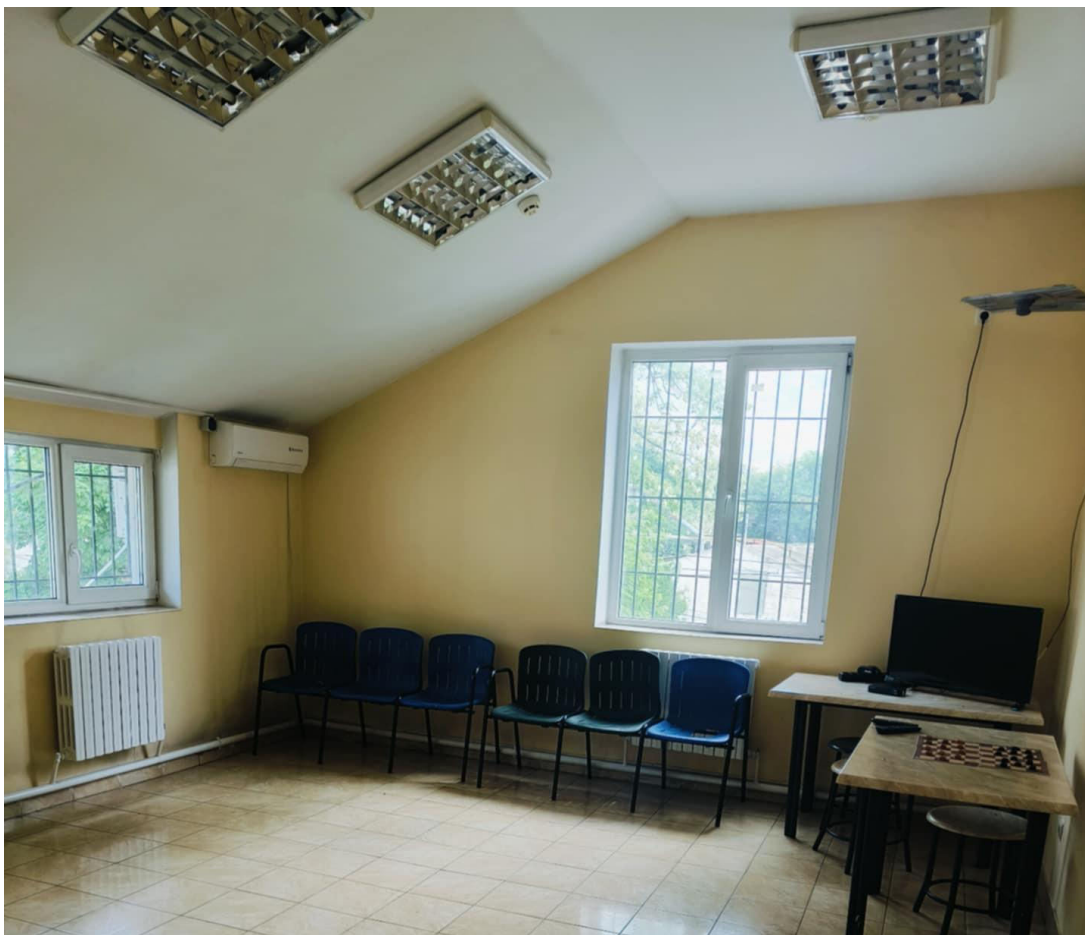
Foto_OAP_spațiu recreație_bloc I_CPTS