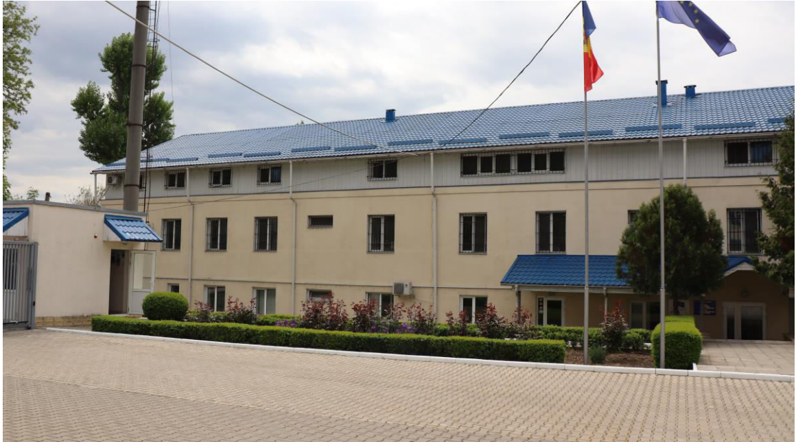
Foto_OAP_blocul I al CPTS