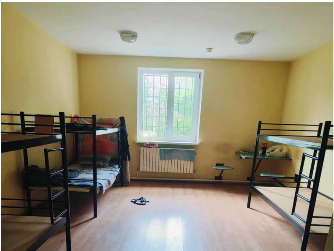
Foto_OAP_spațiu de cazare_bloc I_CPTS