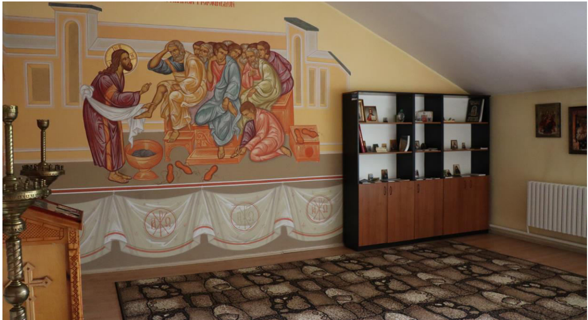
Foto_OAP_spațiu creștin_bloc I_CPTS