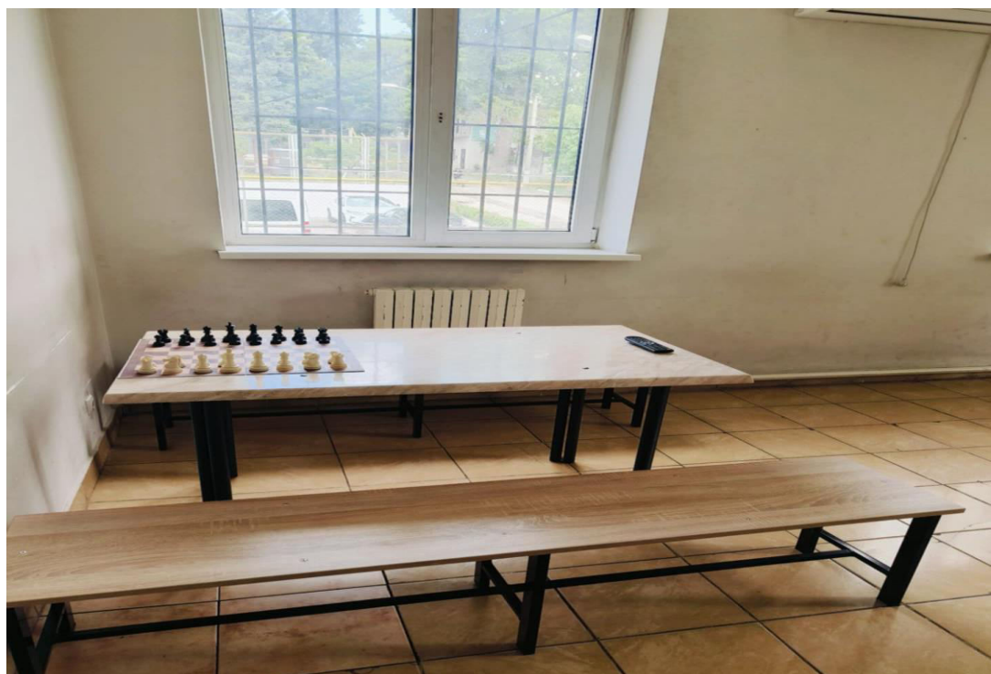
Foto_OAP_spațiu recreație_bloc I_CPTS