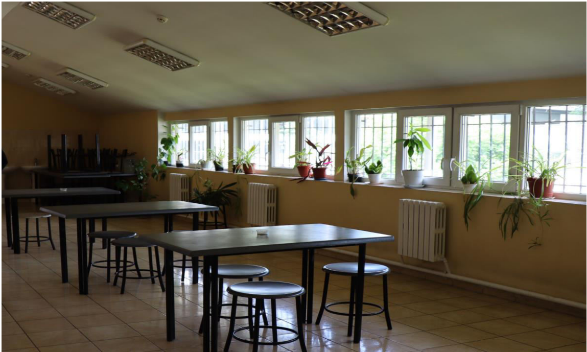
Foto_OAP_spațiu comun servirea mesei_bloc I_et III_CPTS