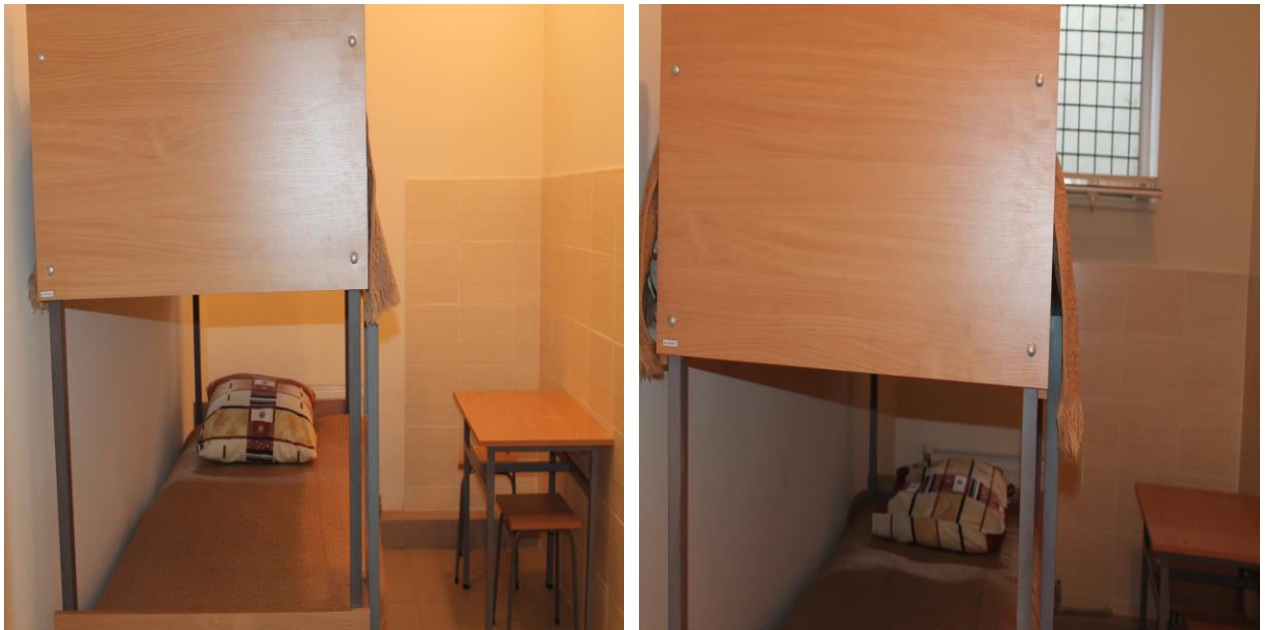
Foto_OAP_odăi solicitanti de azil_SPF Ocnita_15.07.2020