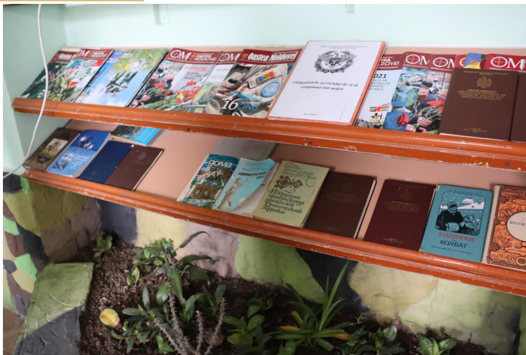
Foto_OAP_sala de odihnă/cursuri_01.02.2022