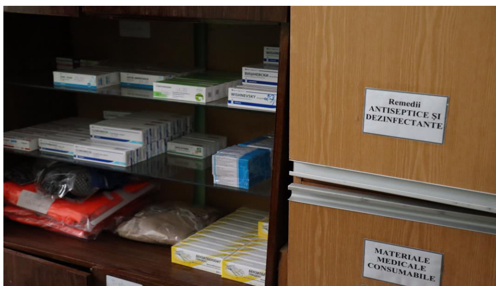
Foto_OAP_punctul medical BIM_01.02.2022

Registrul de evidență a asistenței medicale prestate și a incidentelor de vătămare înregistrate în unitatea militară conține date cu privire la ziua înregistrării, numele militarului, circumstanțele adresării/ traumei; nivelul de asistență medicală, însemnările asistentului medical. Totuși, echipa de vizită a remarcat absența unor registre existente distinct per incident, unul dintre registre fiind în putere de a cumula mai multe tipuri de leziuni, cu origini și cauze divergente – se atestă că o asemenea practică ar împiedica procesul de monitorizare și de raportare a fenomenelor existente în unitatea militară, astfel încât să fie adoptate soluții optime.