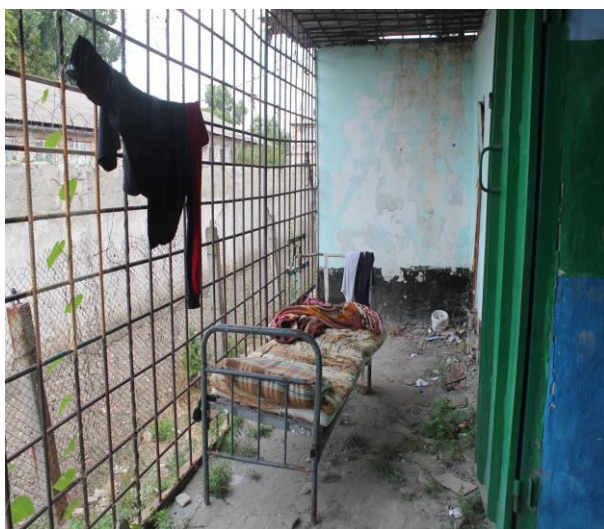
Foto_OAP_boxă pentru greva foamei_31.07.2019