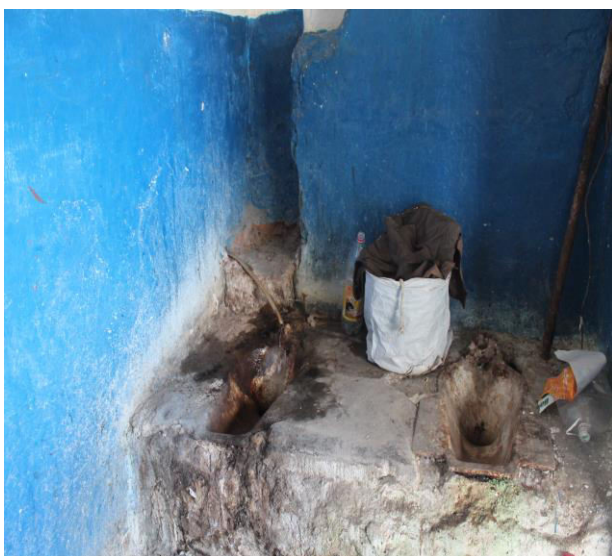
Foto_OAP_boxă pentru greva foamei_31.07.2019