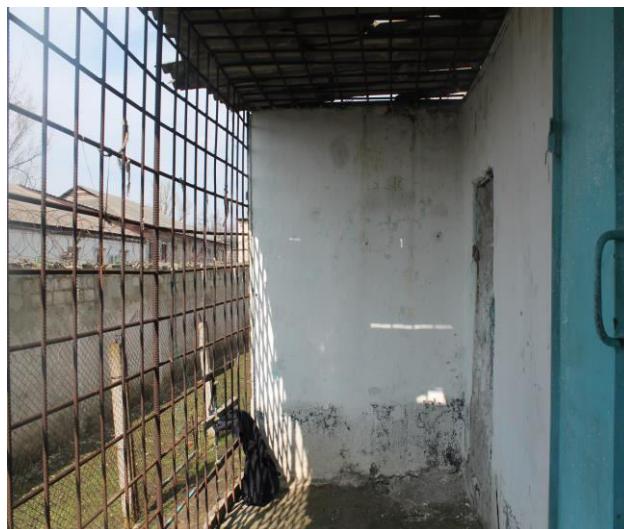
Foto_OAP_boxa pentru greva foamei_16.03.2021