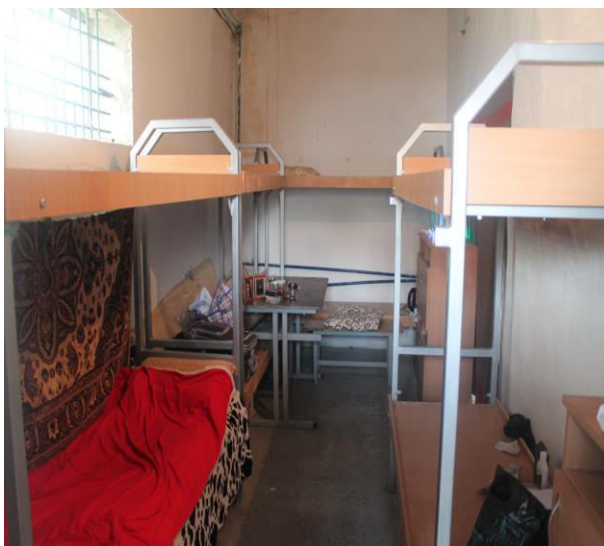
Foto_OAP_boxa pentru greva foamei_16.03.2021