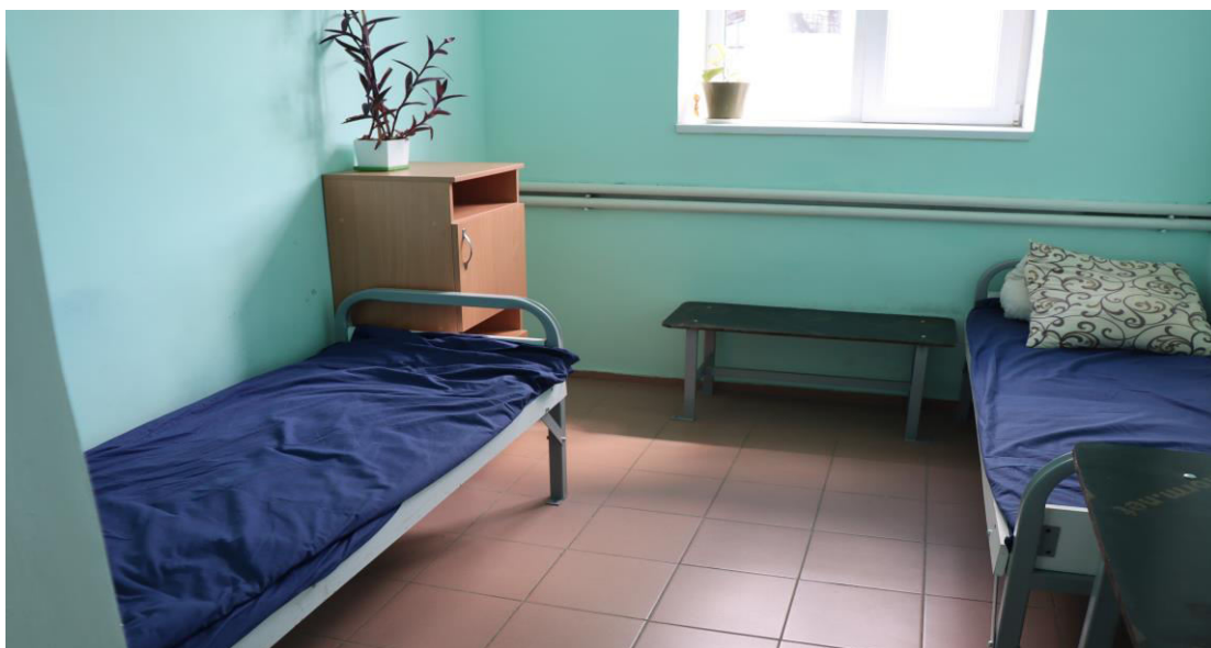
Foto_OAP_izolator medical renovat_18.05.2022