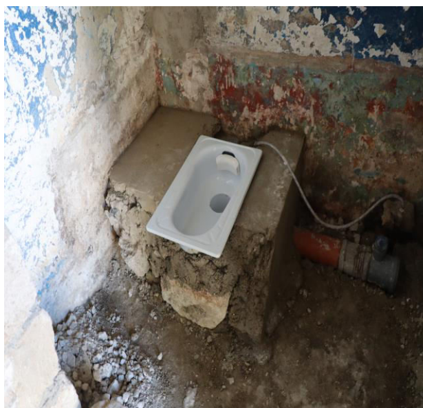
Foto_OAP_boxa pentru greva foamei în renovare (ecluză)_18.05.2022