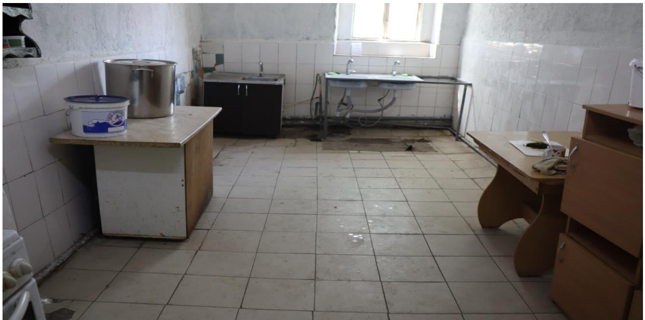
Foto_OAP_P-18_cantină improvizată_sect. 10_18.05.2022