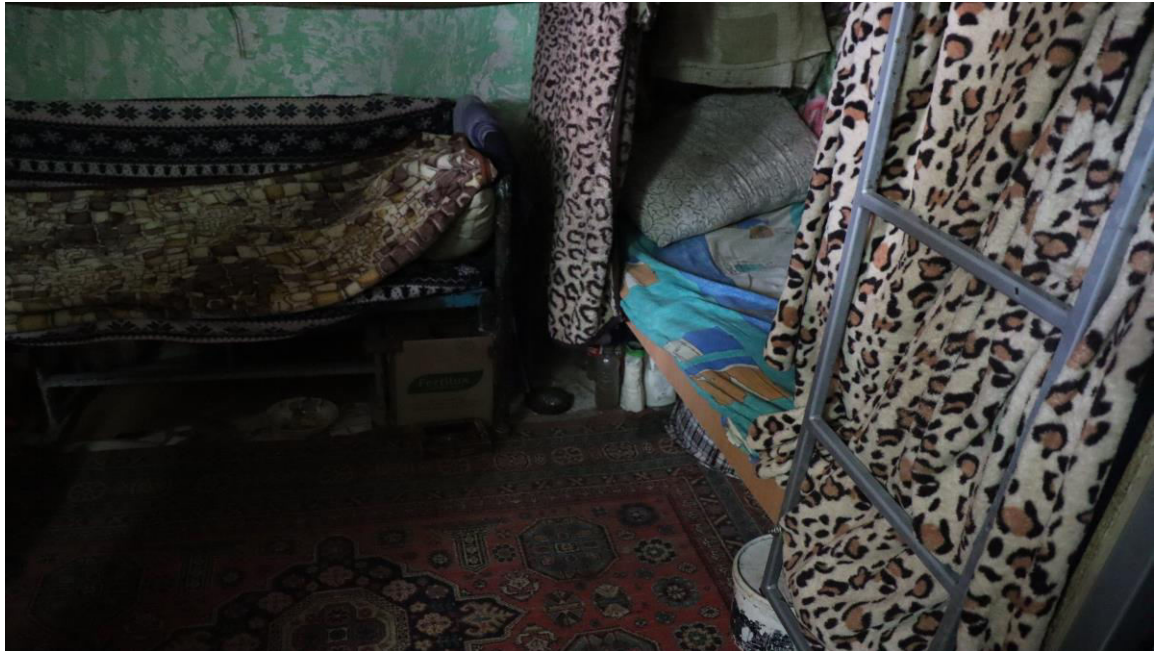
Foto_OAP-P-18_celula din demisol_sect. 10_18.05.2022