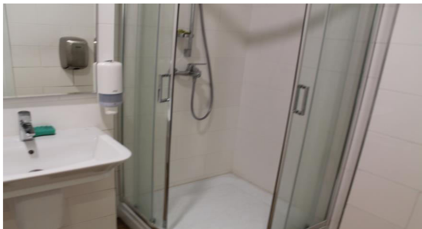
Foto_OAP_AIC_odăile solicitanților de azil_05.12.2019