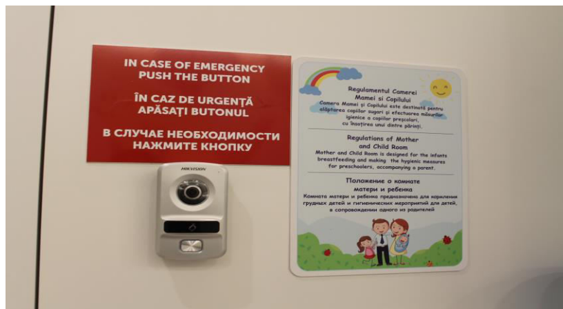
Foto_OAP_AIC_odaia pentru mamă și copil _05.12.2019

Potrivit angajaților PF, cetățenii respectivi, inclusiv alți doi străini erau în acest spațiu (sala de plecare) din 04 decembrie 2019, orele 18.20, adică se aflau timp de peste 22 ore. La fel, angajații PF au menționat că accesul la hrană și apă este asigurat de compania AIR Moldova. Reprezentantul companiei, a informat echipa că în perioada de timp sus menționată, ar fi asigurat