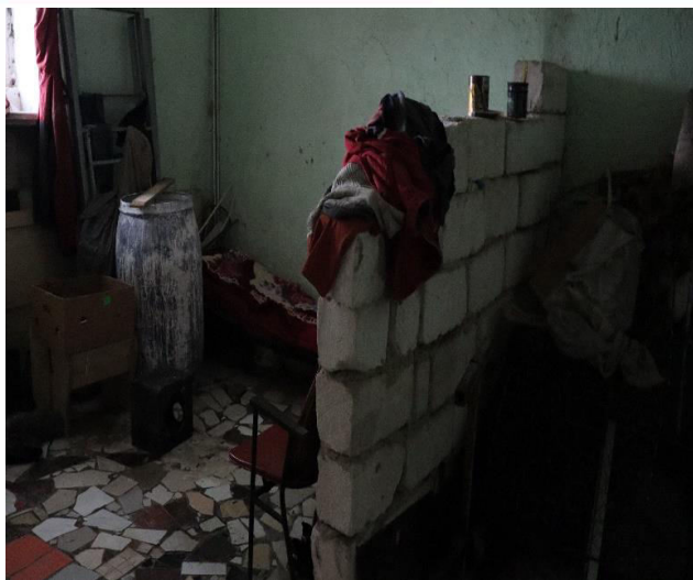
Foto_OAP-P-18_celula din demisol_sect. 10_08.08.2023